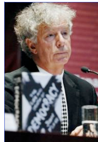
Un catedrático de Westminster avisa de las debilidades de los parlamentos